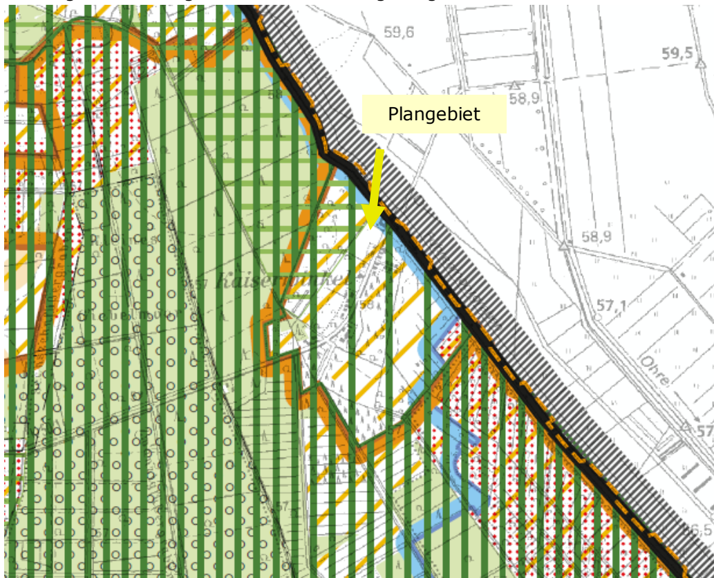
Abb. 2: Ausschnitt aus dem Regionales Raumordnungsprogramm von 2008.

Der Ort Kaiserwinkel, in dem sich der Geltungsbereich dieses Bebauungsplanes befindet, ist als Vorbehaltsgebiet Landwirtschaft sowie als Vorbehaltsgebiet Natur und Landschaft gekennzeichnet. Außerdem befindet er sich in einem Vorranggebiet für Trinkwassergewinnung. Das hohe naturräumliche Potenzial der Umgebung findet sich in den zeichnerischen Darstellungen eines Vorbehaltsgebiet für Erholung sowie eines Vorbehaltsgebiet für besondere Schutzfunktionen des Waldes wieder. Die abgeschieden liegende Ortslage ist davon inselartig umgeben.