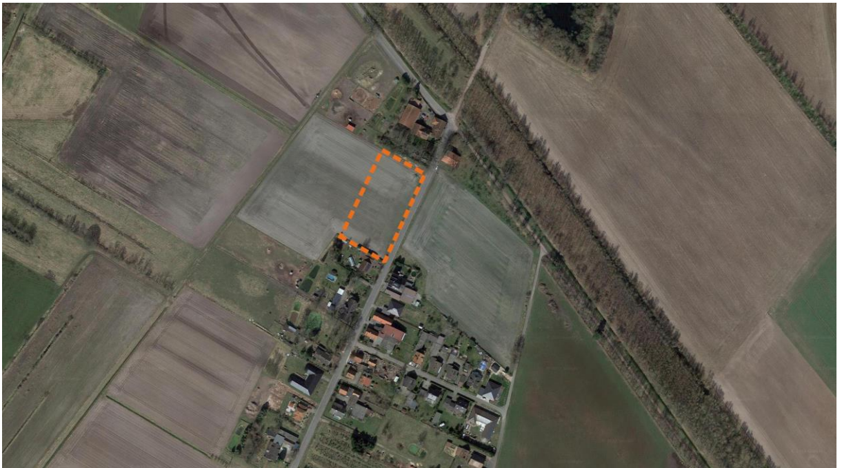
Abb. 1: Lage des Geltungsbereiches.

Das Plangebiet befindet sich im Norden des Ortes Kaiserwinkel, nur wenige Meter von der Grenze zum Bundesland Sachsen-Anhalt entfernt. Die Spuren der innerdeutschen Teilung sind auch heute noch erkennbar (s. Abb. 1). In Kaiserwinkel leben ca. 90 Personen. Der Ort ist über Kreisstraßen von Giebel und Zicherie erreichbar. Das Dorf Parsau ist 7 km entfernt.